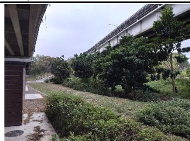
照片 5-1 生態保全對象 1 環境照

(3) 生態保全對象現況說明：現況喬灌木生長良好，工程施工期間應盡可能避免破壞。