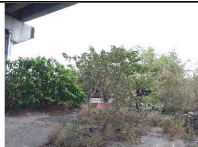
照片 5-3 生態保全對象 2 環境照

(3) 生態保全對象現況說明：下植栽生長不易，工程迴避並確保施工期間保全範圍無施工擾動，如有外來物種移除，應以人工移除為優先。