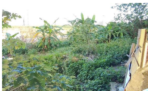
現地 4：照片 2-4 日期：112 年 10 月 22 日 位置：計畫範圍外綠地