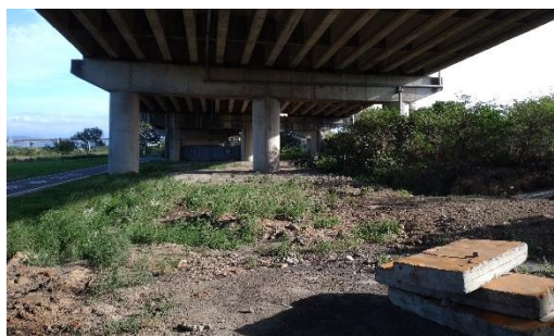
現地 3：照片 2-3 日期：112 年 10 月 22 日 位置：頭前溪千甲出入口