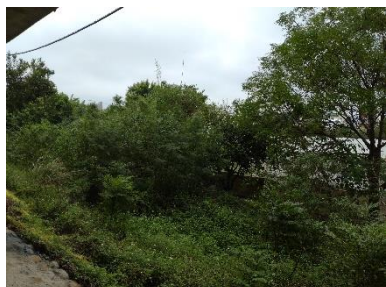
照片 5-2 生態保全對象 1 特寫照

(3) 生態保全對象現況說明：現況喬灌木生長良好，工程迴避並確保施工期間個體存在及不受損傷。